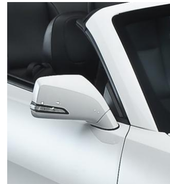
Nouveaux rétroviseurs avec rappel clignotant