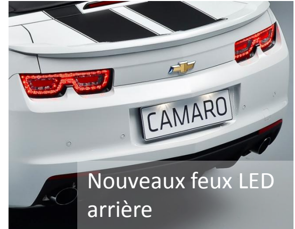
Nouveaux feux LED arrière