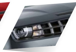
Ashen Grey (métallisée)