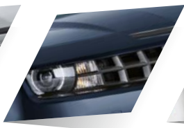
Imperial Blue (métallisée)