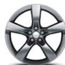
Jantes aluminium 20" avant/arrière