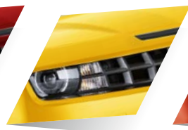
Rally Yellow (spéciale)