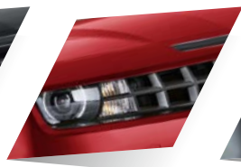
Crystal Red (spéciale)