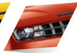
Inferno Orange (spéciale)