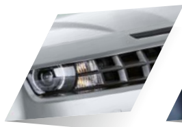
Silver Ice (métallisée)