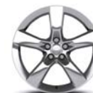
Jantes aluminium poli 20" avant/arrière